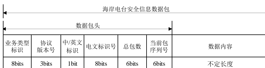
图2 海岸电台安全信息电文结构