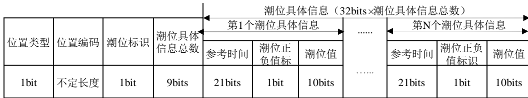
图8 水文潮位数据记录电文格式

“数据类别”为0时，数据内容由1条或多条水文潮位数据记录组成，电文格式如图8所示；“数据类别”为1时，数据内容由1条或多条水文气象其他数据记录组成，电文格式如图9所示。