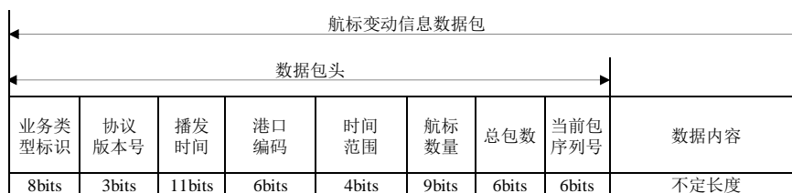
图10 航标变动信息电文结构

岸基播发系统向用户终端发送对应港口相应时间范围内的航标变动信息，电文编码规则如图10所示。