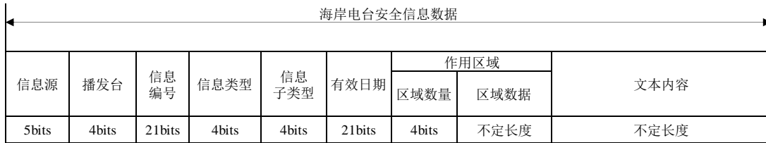
图3 海岸电台安全信息数据内容电文结构

海岸电台安全信息数据内容由信息源、播发台、信息编号、信息类型、信息子类型、有效日期、影响区域和文本内容等数据项组成。电文结构规定如图3所示。