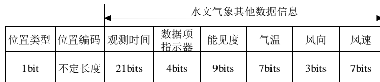
图9 水文气象其他数据记录电文格式