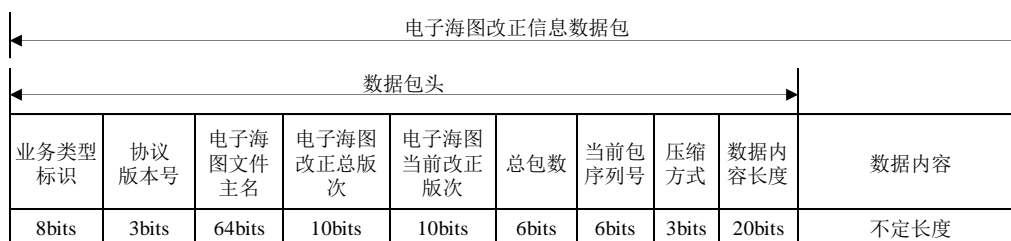
图6 电子海图改正信息电文结构