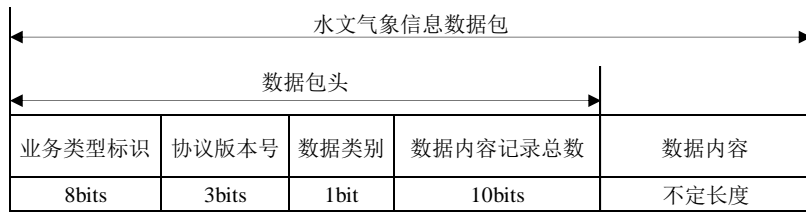
图7 水文气象信息电文结构