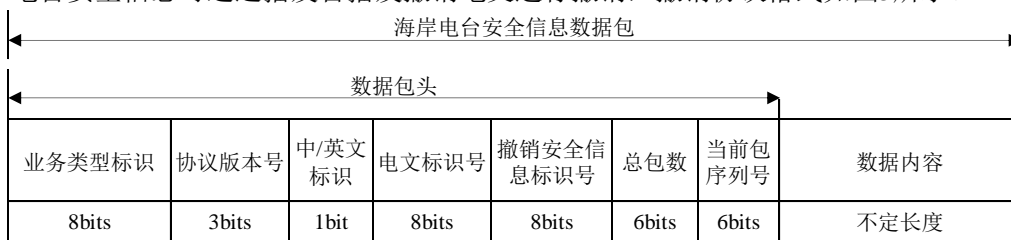
图5 海上安全信息撤销协议格式